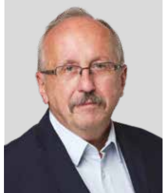
Niedermüller Péter polgármester

Jelen kiadványban összefoglaltuk a bérlők számára legfontosabb tudnivalókat, valamint bemutatjuk, hogy a lakhatáshoz kapcsolódóan miben számíthat még az önkormányzatunk segítségére.